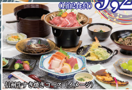
信州牛すき焼きコース (イメージ)